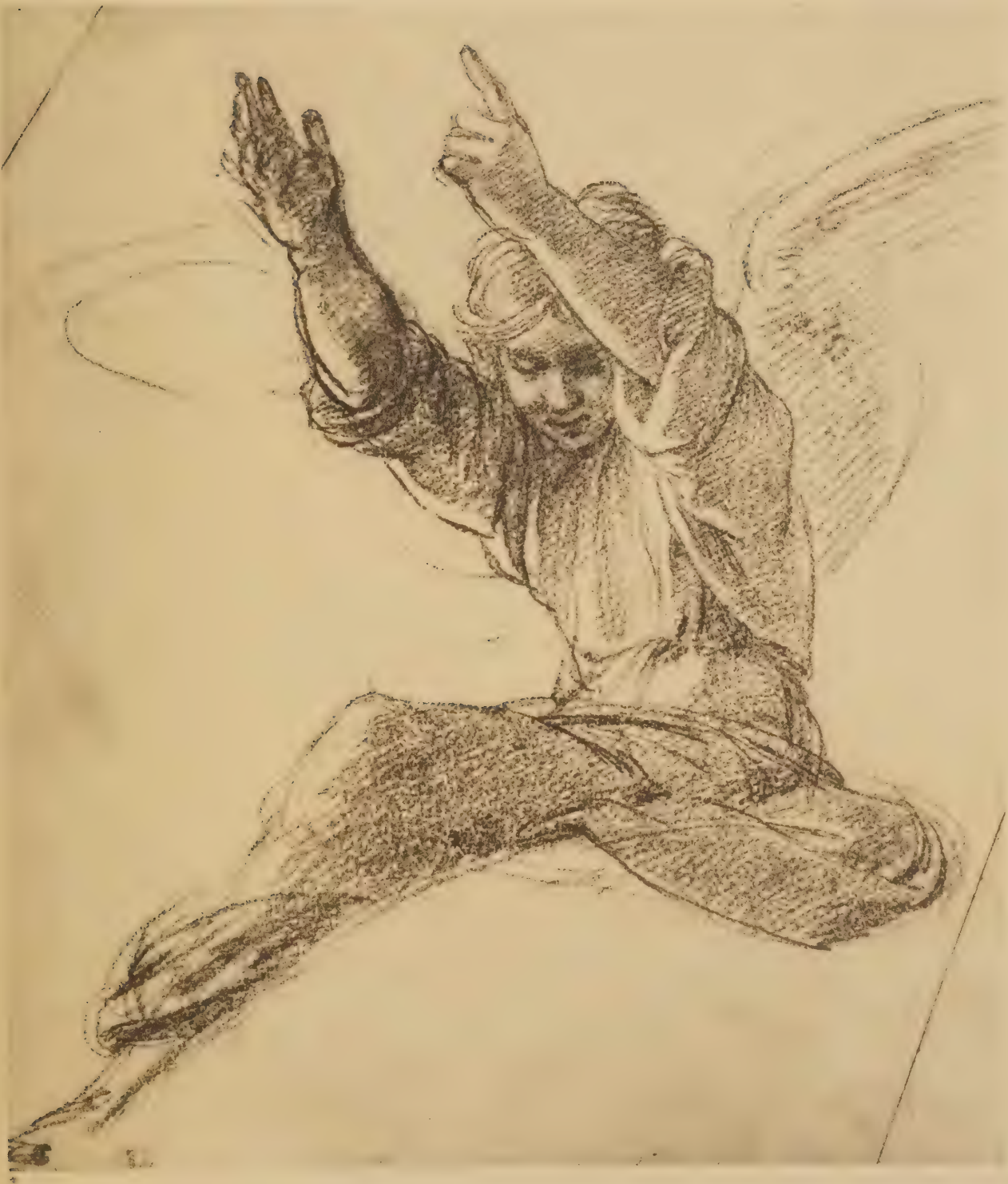
Etude pour l'ange qui se trouve sur la planète de Jupiter dans la Chapelle Chigi